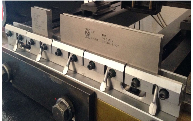
レバーで簡単に1Vダイをクランプ・アンクランプ